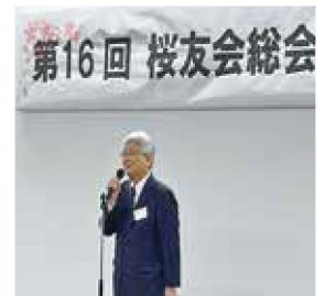
開会の挨拶 平原桜友会会長

総会の議事録は桜友会のホームページ( http://showa-ohyukai.jp/ )に掲載されております。是非ご覧ください。